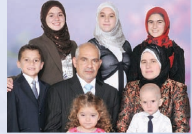
اسم رب الأسرة: