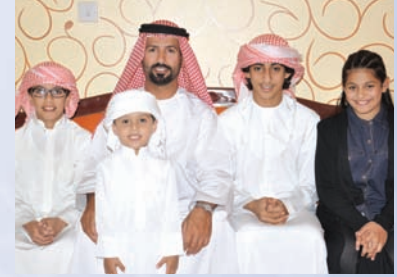
اسم رب الأسرة: